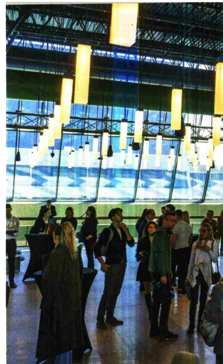
Коктел-сала са златним зидом

Улагање у обнову износило је сто осамнаест милиона евра. Захваљујући реновирању, Сава центар уместо некадашњих 16, добио је 46 сала.