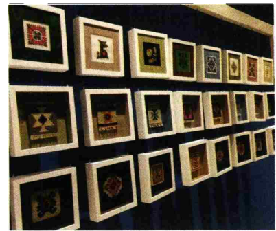
Део етно-поставке обновљеног Сава центра