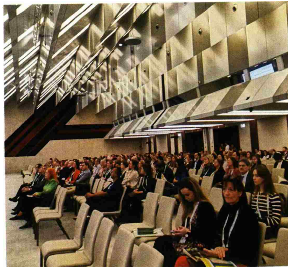
Учесници првог европског конгреса после реновирања