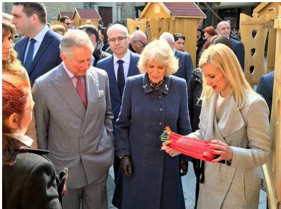
Princ Čarls, vojvotkinja Kamila i Violeta Jovanović, Novi Sad

– Princ je želeo da kupi ćilim i bio je iznenađen što ni u Beogradu nema etno galerije gde mogu da se kupe rukotvorine i tradicionalni proizvodi sa geografskom oznakom i imenom porekla što bi stvorilo izvor prihoda za brojne porodice i nezaposlene žene iz svih krajeva Srbije – ističe Jovanović u izjavi Pirotskim vestima. Poslušajte audio izjavu Violete Jovanović.