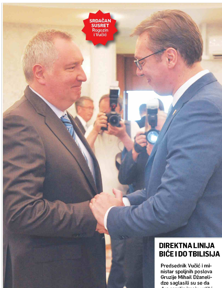
SRDAČAN SUSRET Rogozin i Vučić

- Prvi strani gost koga je primio predsednik Vučić. Ovo je priznanje posebnog odnosa između Rusije i Srbije. Razgovarali smo o ekonomskoj i vojno-tehničkoj saradnji - napisao je visoki ruski zvaničnik.