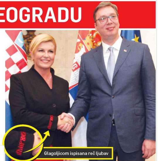
Glagoljicom ispisana reč 'ljubav'