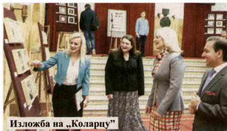
Изложба на „Коларцу“