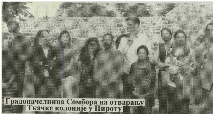
Градоначелница Сомбора на отварању Ткачке колоније у Пироту

Ткачку колонију организује Етнومрежа, у партнерству са градовима Пирот и Сомбор, НАЛЕД-ом и локалном занатском задругом „Дамско срце“ и уз подршку амбасада Канаде и САД.