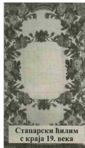
Стапарски ћилим с краја 19. века

Први кадрови снимљени су на IV међународној ткачкој колонији коју је у